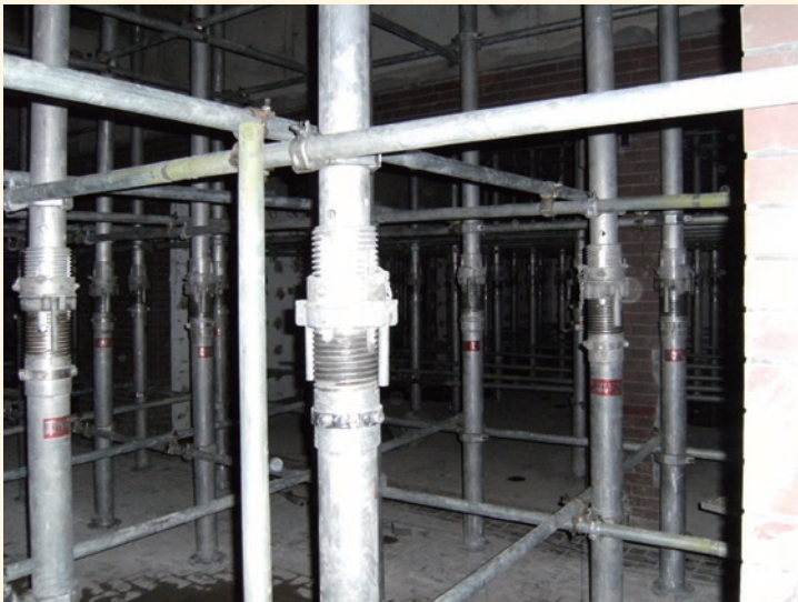
■ ベースプレート (キャリングハンドル)

(注)表中、「中間部・水平つなぎ あり」とは、本製品の高さ2m以内ごとに水平2方向に水平つなぎ専用クランプで取り付けること。