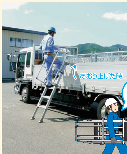
■ 側面あおりに設置