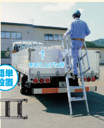
■ 背面あおりに設置