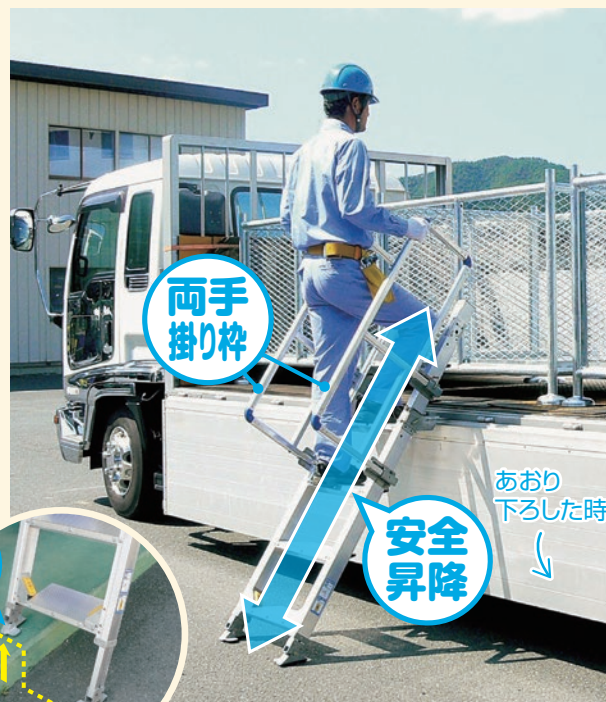
■ 側面あおりを倒して設置