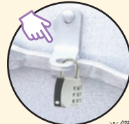
※鍵は付属していません。