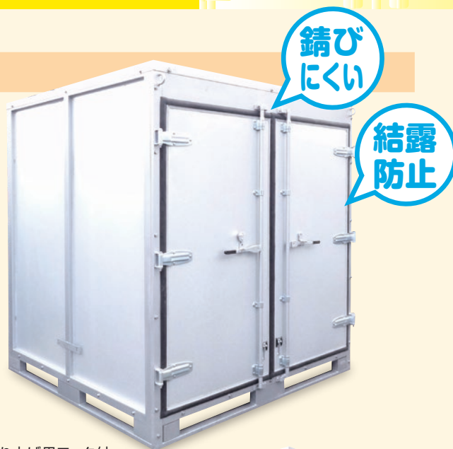
吊り上げ用フック付